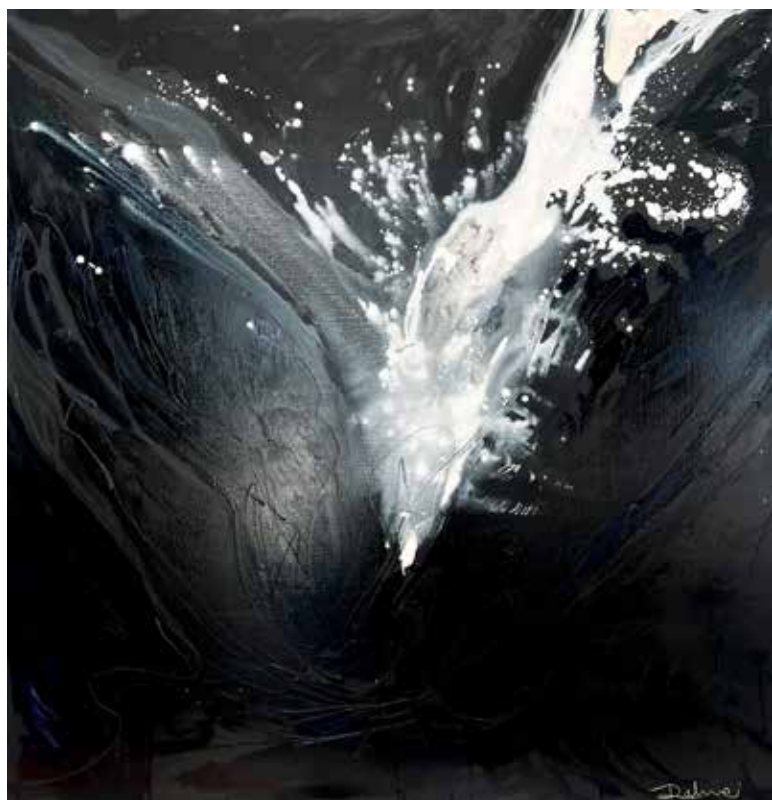
Ruptis. Serie Magnolias de María Magdalena . 130 x 130 cms. Mixta sobre lienzo. 2022.