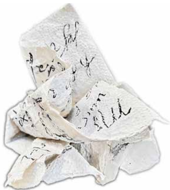
Amor mío. Piezas de cerámica, 22 cms c/u aproximado. 2024.