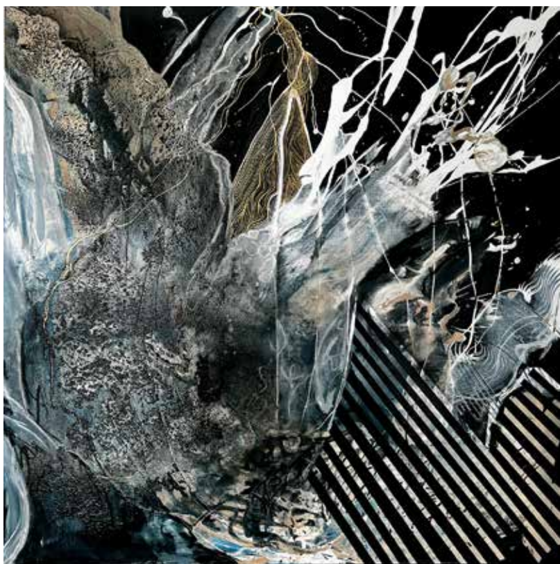
Nova II. Serie Scupulis. 130x130. Mixta sobre lienzo. Ubicación Tuxtla Gutiérrez.