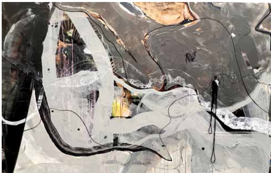
2 Serie: Danzando entre memorias. 120 x 220 cms. 2024. Ubicación Tuxtla Gutiérrez