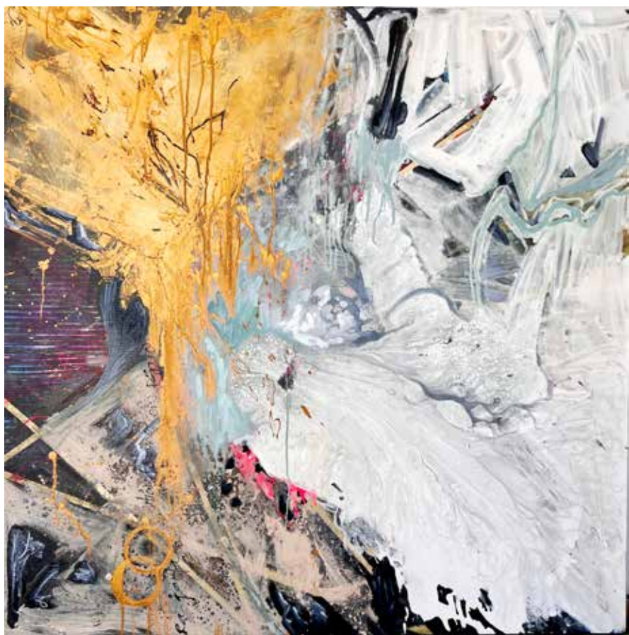
Sirius. Serie Scopulis. 130 x 130 cms. Mixta sobre lienzo. 2023.