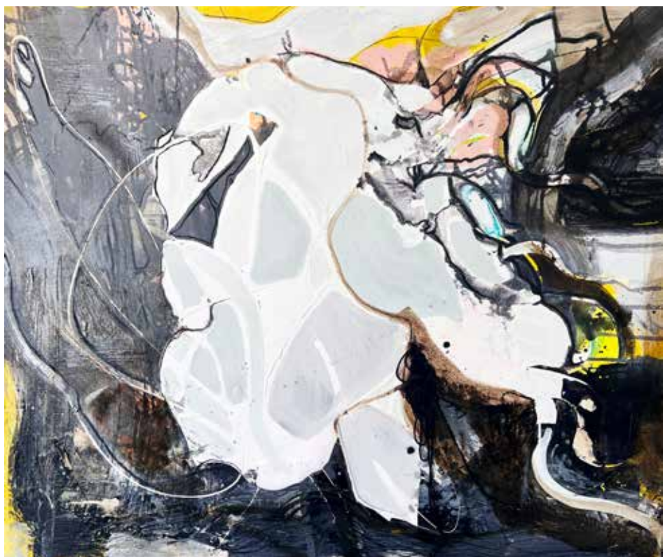
Serie: Danzando entre memorias. 125 x 145 cms. 2024. Ubicación Tuxtla Gutiérrez, obra disponible.