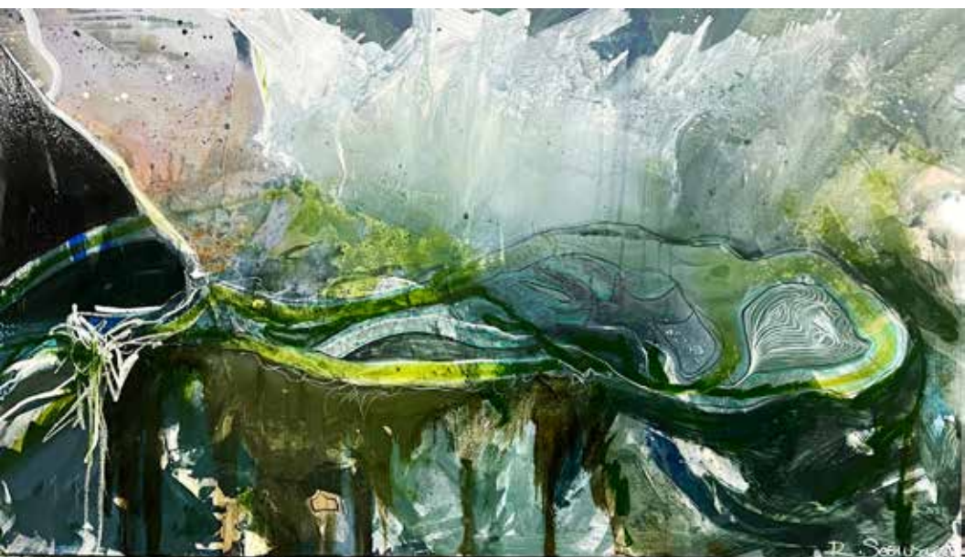
Cronos 1. Serie Luz de lunas. 100x175 cms. Mixed on canvas.