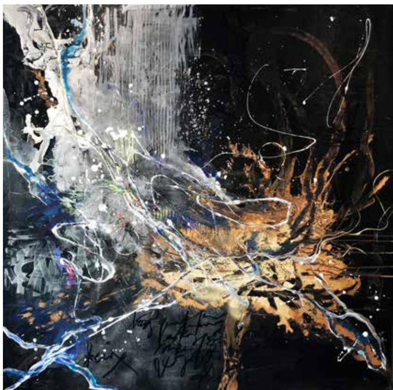
Fenix. Serie Sirius. 130 x 130 cms. Nixta sobre lienzo. 2020.