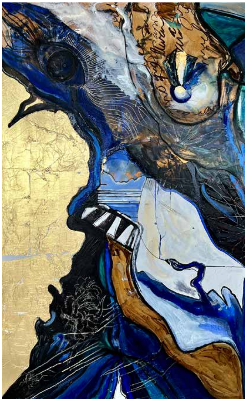
Golden Journey. Serie scopulis. 220x300 cms. Encausto mixto sobre lienzo 2022. Ubicación Tuxtla Gutiérrez.